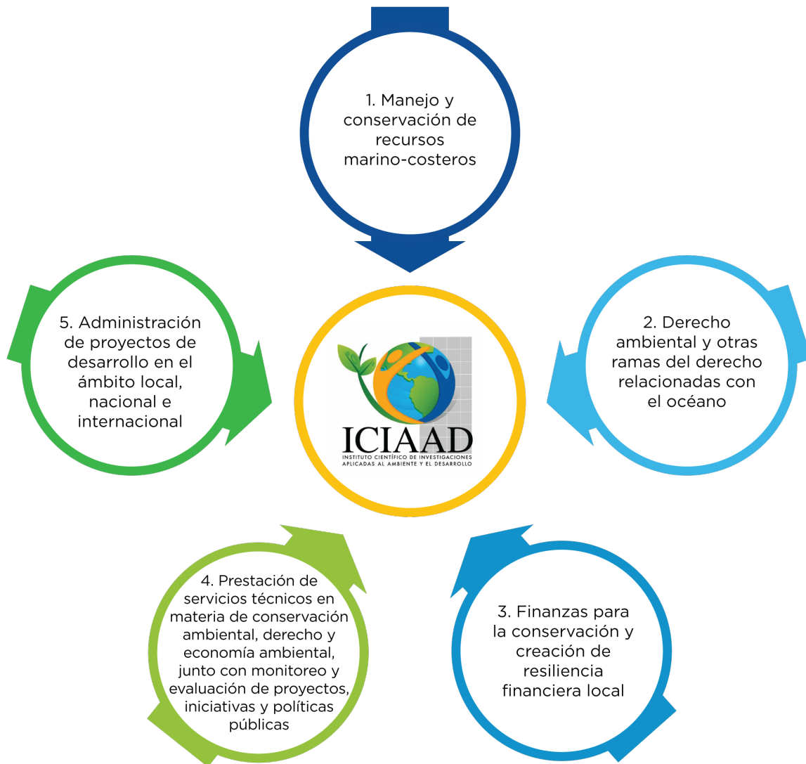
Figura No. 02 Ejes de trabajo del ICIAAD